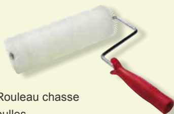
Rouleau chasse bulles