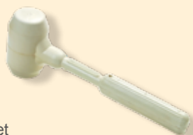
Maillet caoutchouc blanc