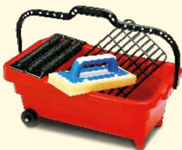
Seau de lavage à 3 rouleaux