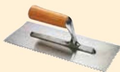
Taloche 3x3 mm