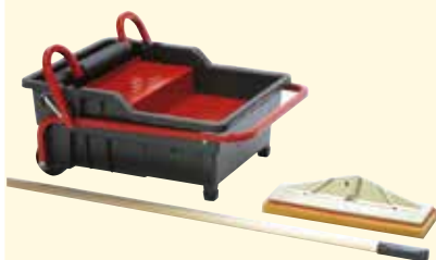
Seau de lavage à 2 rouleaux + taloche éponge et manche