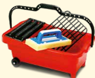
Seau de lavage à 3 roueaux