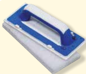
Feutre souple blanc