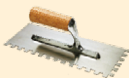
Spatule 28x12 cm dent carrée 10 mm INOX