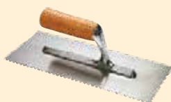
Spatule 28x12 cm dent carrée 8 mm INOX