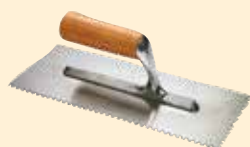
Taloche 8x8 mm