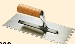
437200 Spatule 28x12 cm dent carrée 10 mm INOX