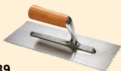
437189 Spatule 28x12 cm dent carrée 8 mm INOX