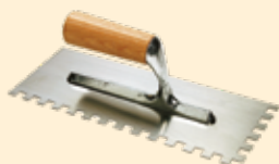
Spatule 28x12 cm dent carrée 10 mm INOX