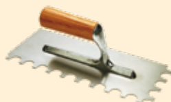
Spatule 28x12 cm dent ronde Ø15 mm INOX